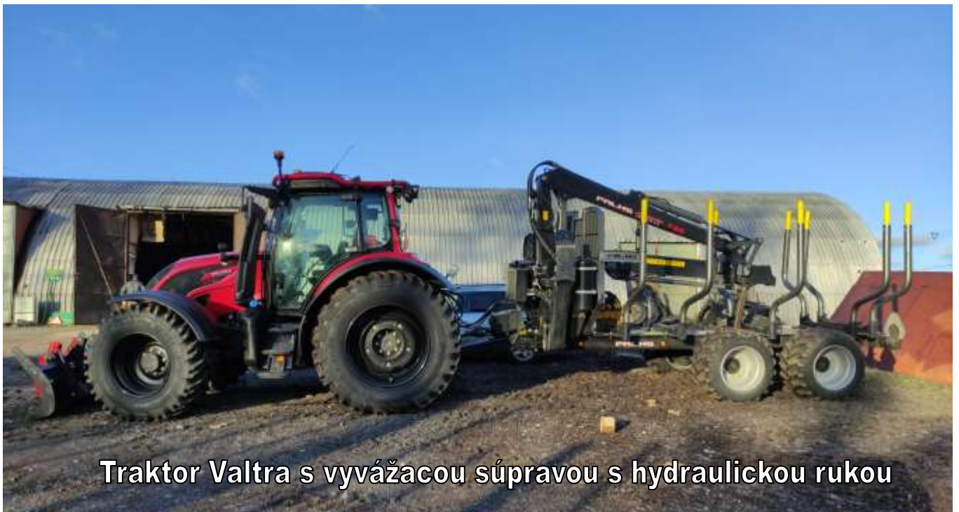
Traktor Valtra s vyvážacou súpravou s hydraulickou rukou

Rekonštrukcia objektu je akceptovateľná len v pôvodnom pôdoryse a výške a bežnom štandarde základného ubytovania, ale len za účelom využitia pre rekreáciu podielnikov UPS Hybe. Aj v tomto prípade však návrh zdroja vody a jej likvidáciu odporúčame konzultovať tak so Správou NAPANTu, ako aj so SSL.