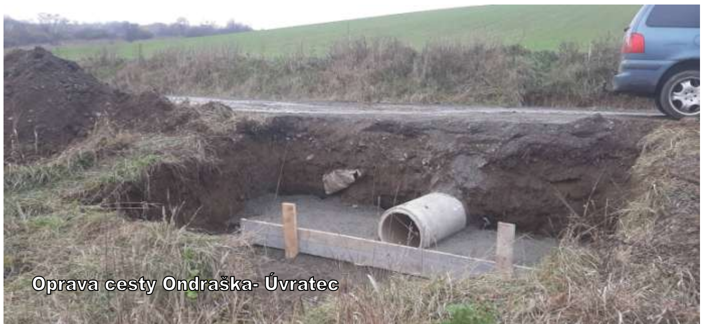
Oprava cesty Ondráška- Úvratec

★ Na rekonštrukciu LC Červená – Hlboká v sume 1 320 000 EUR je podaný projekt na čerpanie dotácie z Programu rozvoja vidieka. Rekonštrukcia sa bude realizovať len v prípade schválenia projektu, podľa ktorého nám bude prefinancované 80 % z preinvestovaných finančných prostriedkov. To predstavuje sumu 1 056 000 EUR .