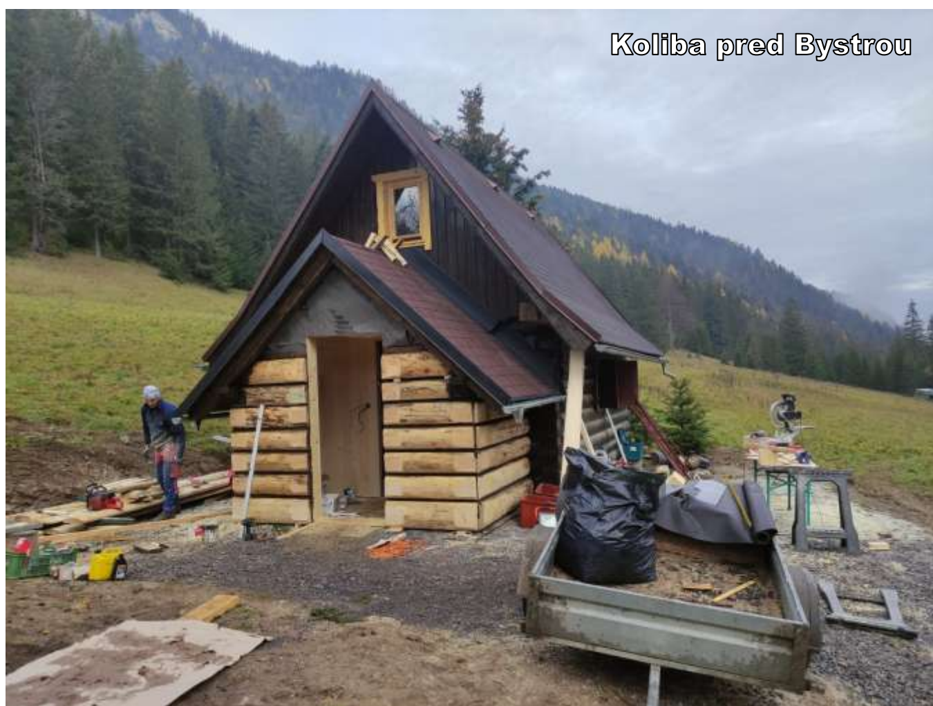
Koliba pred Bystrou