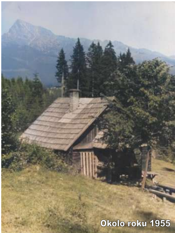
Okolo roku 1955