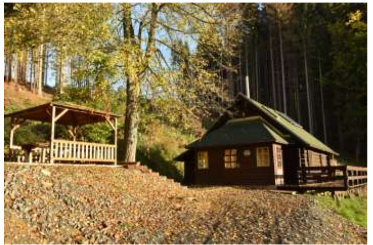
Chata Krivánka, včera a dnes